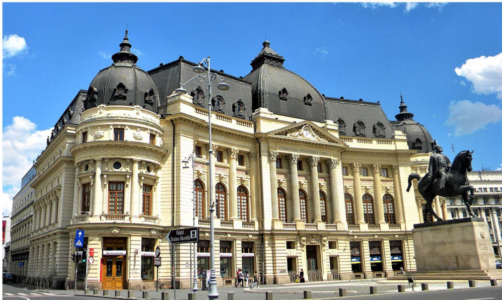
BIBLIOTECA CENTRALĂ UNIVERSITARĂ „CAROL I”