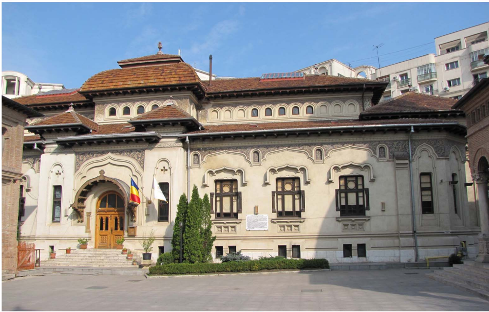
BIBLIOTECA SFÂNTULUI SINOD