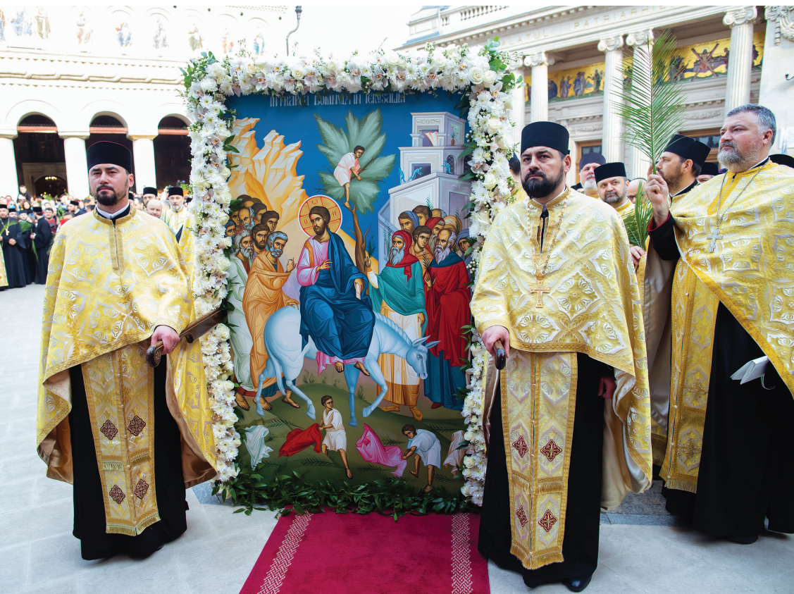
Icoana Intrării în Ierusalim purtată în procesiune la pelerinajul de Florii, sâmbătă, 16 aprilie 2022