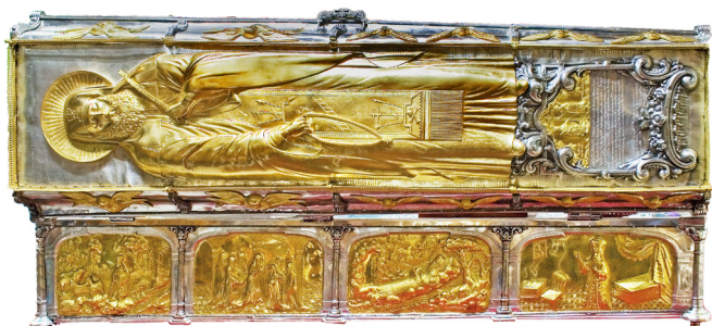
Racla cu moaștele Sfântului Dimitrie cel Nou de la Catedrala Patriarhală

Procesiunea cu fragmentul din Lemnul Sfintei Cruci, icoana și moaștele Sfântului Ierarh Nectarie de la Eghina și icoana Sfântului Cuvios Serafim de Sarov va pleca de la Catedrala Mitropolitană Sfântul Spiridon – Nou pe străzile Șerban Vodă și Bibescu Vodă până la baza Colinei Bucuriei .