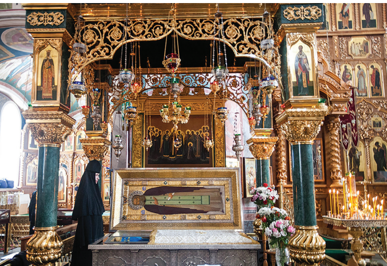
Racla cu sfintele moaște ale Sfântului Cuvios Serafim de Sarov de la Mănăstirea Diveevo

avut loc la 19 iulie 1903, în prezența familiei imperiale, a numeroșilor ierarhi și a unei mulțimi de sute de mii de persoane, venite din toate părțile Rusiei.