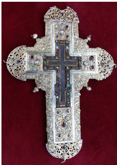
Fragment din Lemnul Sfintei Cruci aflat în patrimoniul bisericii Sfântul Vasile – Victoria

Probabil au fost ascunse din cauza faptului că, în anii 1950-1960, statul român comunist a rechiziționat pentru Muzeul Național de Istorie majoritatea obiectelor de patrimoniu care se găseau în biserici și, pentru a nu fi luate, ele au fost așezate între documentele de arhivă, păstrate în acest loc. După Revoluție, ele au fost găsite și așezate la închinare.