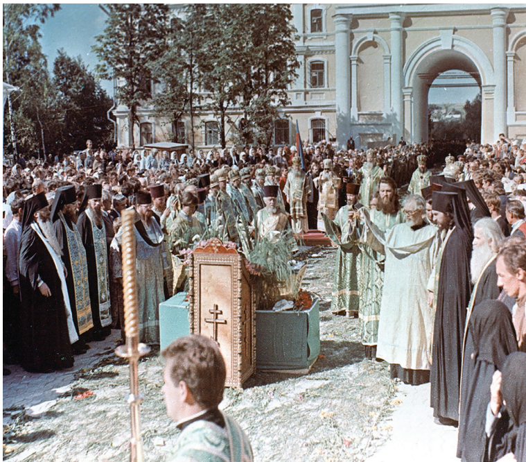
Moment din timpul procesiunii cu sfințele moaște ale Sfântului Cuvios Serafim de Sarov din vara anului 1991

Soarta ulterioară a moaștelor nu poate fi decât presupusă.