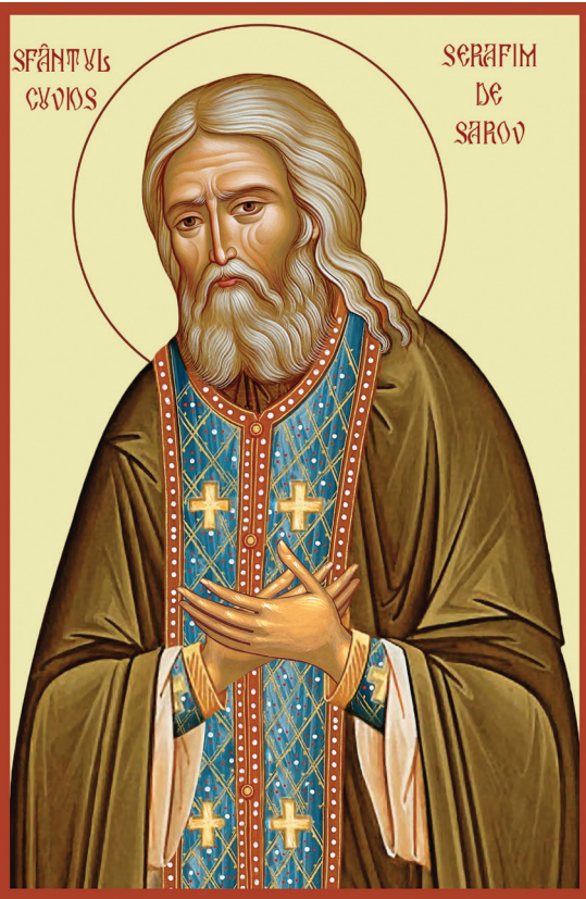
Sfântul Cuvios Serafim de Sarov

ani, el petrecea noaptea în rugăciune, înainte de a săvârși Dumnezeiasca Liturghie. La puțină vreme după hirotonirea sa și după moartea duhovnicului său, el a primit încuviințarea de a se retrage în singurătate, în adâncul pădurii, la 6-7 km de mănăstire, unde și-a făcut o colibă de lemn, înconjurată de o mică grădină, pe o colină pe care el a numit-o „Sfântul Munte”, gândindu-se la Muntele Athos. Petrecea acolo toată săptămâna, întorcându-se la mănăstire numai duminicile și în zilele de sărbătoare, stăruind în rugăciune, citirea Sfințelor Scripturi,