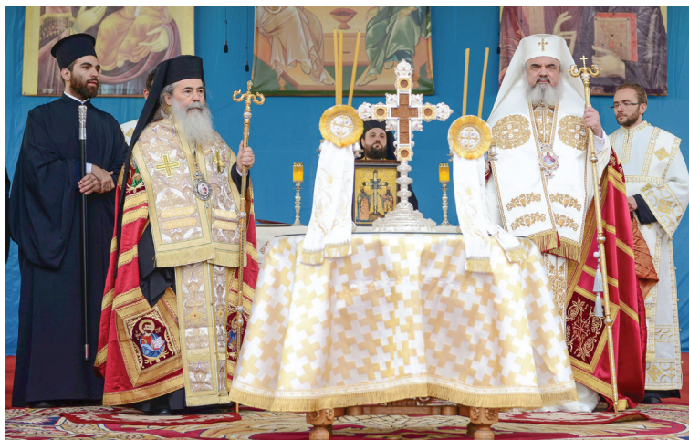
Patriarhul Teofil al Ierusalimului și Părintele Patriarh Daniel, cu prilejul aducerii la București a unui fragment din Cinstitul Lemn al Sfintei Cruci, 24 octombrie 2014

Prezența unui fragment al lemnului Sfintei Cruci în aceste zile, pe Colina Bucuriei , ne invită să reflectăm și asupra suferințelor creștinilor care, de-a lungul secolelor, au mărturisit în viața lor credința în Hristos ca temei al spiritualității românești, adeseori cu prețul jertfirii propriei vieți.