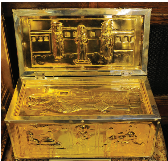
Racla cu moaștele Sfântului Ierarh Nectarie de la Eghina, de la Catedrala Patriarhală

La încheierea slujbei, Preafericitul Părinte Patriarh Daniel va rosti cuvântul de binecuvântare .